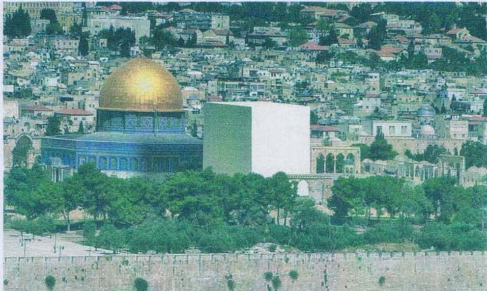
"קובייה ירושלים 2009" (הדמיא דיגיטלית). ירושלים זקוקה לצורה שלוש הדתות המונותאיסטיות יכולות להדהות איתה