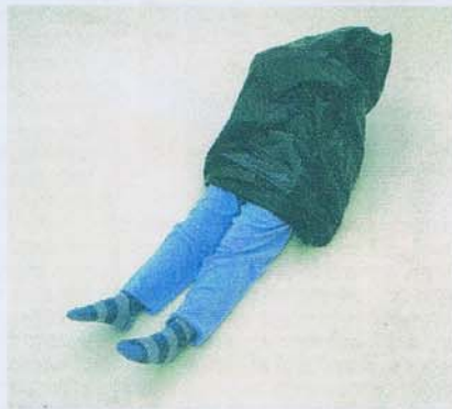
פרגמטים מתוך העבודה "Haus U R" במזיאון עולם סטרילי עם שרדי חיים

המטאפורית של הכעבה בפועל, בתוך כיכר סן מרקו שבונציה, שוב במסגרת הביאנלה לאמנות. לטענתו, לא העלה לרגע ברעונו שהקובייה השחורה שלו תעורר התנגדות בקרב מוסלמים, ובטח שלא חלם שיצננו אותו. "קוביית מכתב נוקב מגנשיא הביאנלה, ובו נכתב שמסטיבות פוליטיות אי אפשר להציב את הקובייה השחורה, ואת נזכח החלטה שהתקבלה ברומא. לא התאפשר לי להציב אותה במקום אחד, אפילו על המים מול חוף ונציה. הצנזורה הגיעה עד לקטלוג, שנותרו בו שישה עמודים שחורים. קוביית המנה להציב את הקובייה בברלין, במוזיאון המבורג בנורף, אבל גם שם לבסוף המליצו לי להציב את הקובייה בניו יורק או בישראל".