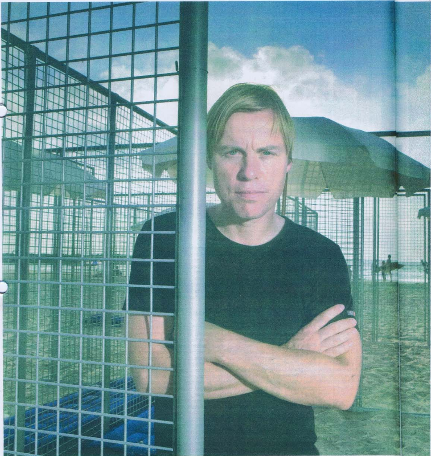
האמן גרגור שניידר לצד עבודתו "21 תאי חוף" בחוף אכדיה, הרצליה. אני תמיד יוצא ממצבים מציאותיים, אף פעם לא מחכה לרעיון